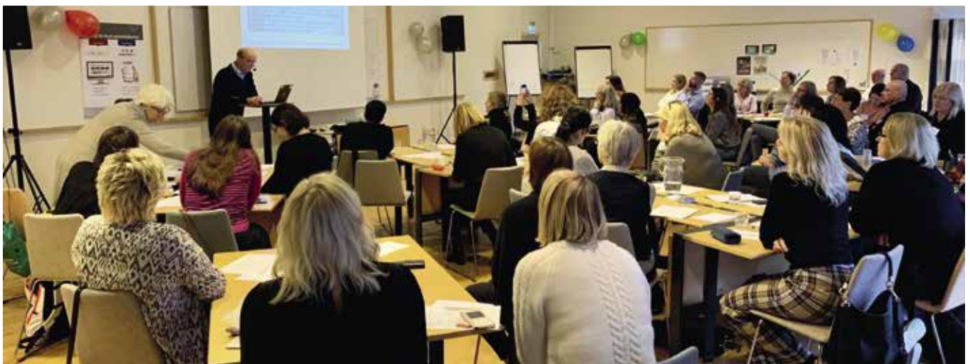
20-årsjubileum, Djurönaset 2019.